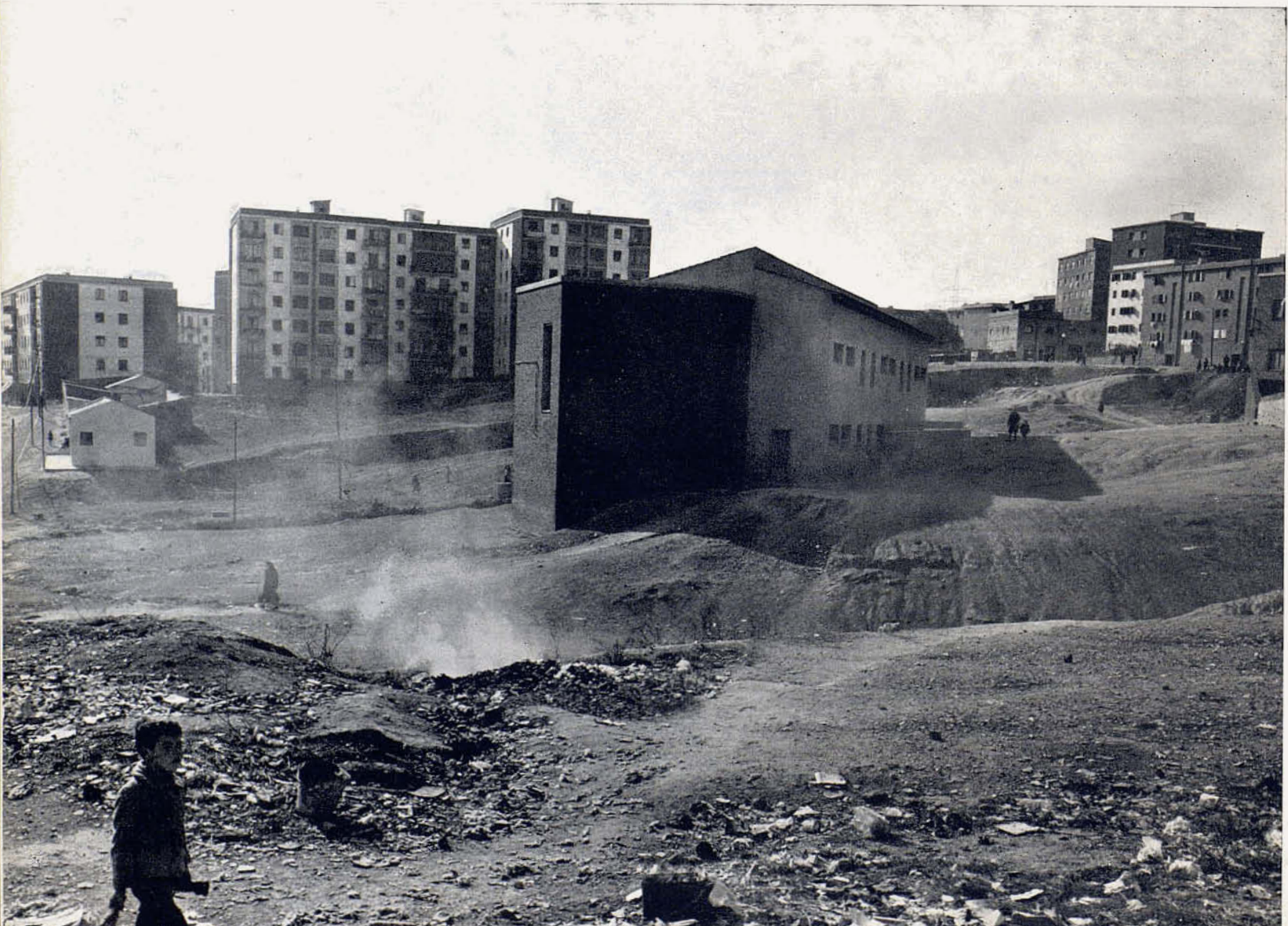
Foto 2: Barranco que separa los bloques del Ayuntamiento de los del Instituto Nacional de la Vivienda. En primer término, la escuela municipal "San Jorge".